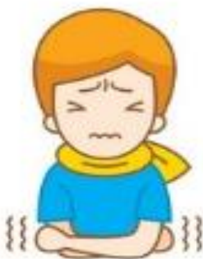
تعریق و لرز

دوره نهفتگی این بیماری از ۱ تا ۱۴ روز است اما در بیشتر موارد بین ۳ تا ۷ روز علائم بروز می کند. بیماری زایی این ویروس سیستم تنفسی را تحت تأثیر قرار می دهد و علائمی مشابه سرماخوردگی ساده را ایجاد می کند. اما این بیماری عمدتاً با لرز، گلودرد و سرفه ی خشک با یا بدون تب بروز می یابد. تعدادی از بیماران نیز علائمی مانند گرفتگی بینی، آبریزش بینی و اسهال دارند. همچنین در برخی از بیماران فقط تب و خستگی خفیف (و غیره) بروز پیدا می کند. بیمارانی که این بیماری در آنها شدت می یابد، دچار مشکل تنفسی و تنگی نفس می شوند